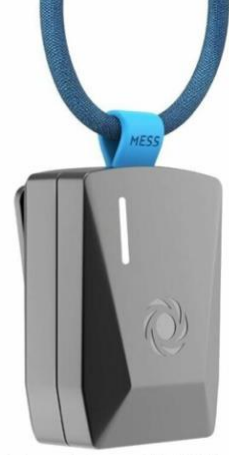
Antik Roma’da kölelerin boynuna takılan plaka vs. MESS’in MESS-SAFE tasarımı