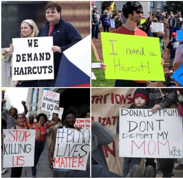
Amerika Birleşik Devletleri’ndeki protestolardan fotoğraflar, Redfish, 2020 ( https://twitter.com/redfishstream/status/1255484870060584961?lang=en )