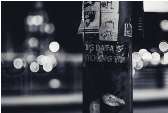
“Büyük veri sizi izliyor” yazılı bir çıkartma, Towards Data Science , 2018 ( https://towardsdatascience.com/the-new-age-of-data-science-725c7b27ac08 )

konumlardan, risk ve güvenlik hesaplamalarından, ulusal ve toplumsal sınır rejimlerinden bağımsız bir beden değildir (krş. Browne 2015). 5 Hangi bedenin ‘yerine göre’ biyolojik-viral tehdit, hedef ya da suçlu olarak kodlanacağı bedensel-konumsal kırılabilirlikleri üreten katmanlı eşitsizliklerden beslenir. Bilhassa pandemi koşullarında, toplumsal risk, halk sağlığı ve güvenliği hesaplamaları ve sınır rejimlerinde buna şahit olduk. Haklar imtiyazlara dönüşürken, “sistemin taşıyıcıları”