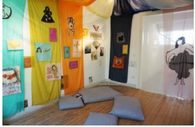
Arzu Yayıntaş, Güneş Terkol, Sevil Tunaboşlu / Ay Çadırı

Nilay: Serginin içeriğine geçecek olursak, “Ay Çadırı” işinden biraz bahsedebilir misiniz? “Ay Çadırı” ismi nereden geliyor; döngüsellğe, aybaşına bir gönderme mi var?